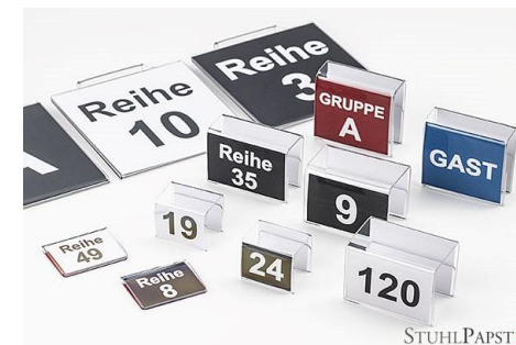
Reihennummerierung Klemme Klein