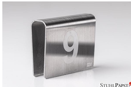
HAR.MONIE Nummerierung Klemme schmal