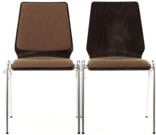
TWI.N de Lux